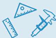
中間検査のやり方が 難しく品質が安定しない