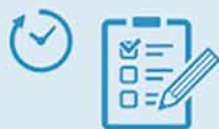
工程内検査の時間が 掛かり過ぎている