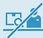
正確に検査できる人材が 確保できない