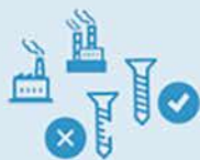
外注先からの納品物の 品質管理ができていない